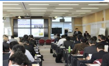
（昨年度の開催の様子）

懇親会に参加される方は、お一人5,000円（予定）となります。ざっくばらんな会ですので是非お気軽にご参加ください。